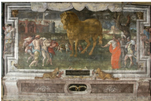
Le cheval de Troie, détail d'une peinture de la galerie Renaissance (1 er étage Aile Renaissance)